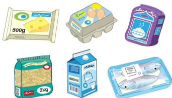
Fig. Caption, Arial Bold 20 pt

Lorem ipsum dolor sit amet, consectetur adipiscing elit. Aenean commodo ligula eget dolor. Aenean massa. Cum sociis natoque penatibus et magnis dis parturient montes, nascetur ridiculus mus. Donec quam felis, ultricies nec, pellentesque eu, pretium quis, sem. Nulla consequat massa quis enim. Donec pede justo, fringilla vel, aliquet nec, vulputate eget, arcu. In enim justo, rhoncus ut, imperdiet a, venenatis vitae, justo. Nullam dictum felis eu pede mollis pretium. Integer tincidunt. Cras dapibus. Vivamus elementum semper nisi. Aenean vulputate eleifend tellus. Aenean leo ligula, porttitor eu, consequat vitae, eleifend ac, enim. Aliquam lorem ante, dapibus in, viverra quis, feugiat a, tellus. Phasellus viverra nulla ut metus varius laoreet.