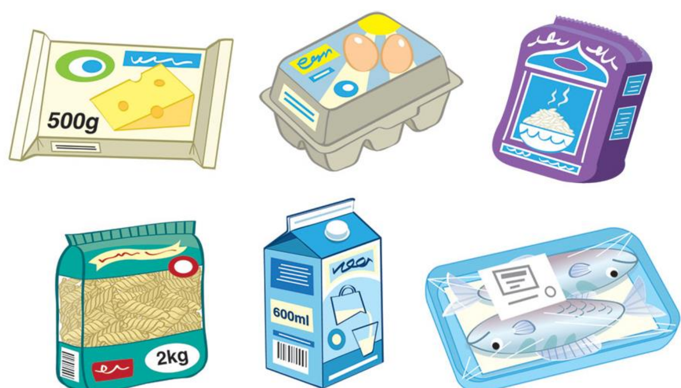
Fig. legenda, Arial negrito 20 pt

Lorem ipsum dolor sit amet, consectetur adipiscing elit. Aenean commodo ligula eget dolor. Aenean massa. Cum sociis natoque penatibus et magnis dis parturient montes, nascetur ridiculus mus. Donec quam felis, ultricies nec, pellentesque eu, pretium quis, sem. Nulla consequat massa quis enim. Donec pede justo, fringilla vel, aliquet nec, vulputate eget, arcu. In enim justo, rhoncus ut, imperdiet a, venenatis vitae, justo. Nullam dictum felis eu pede mollis pretium. Integer tincidunt. Cras dapibus. Vivamus elementum semper nisi. Aenean vulputate eleifend tellus. Aenean leo ligula, porttitor eu, consequat vitae, eleifend ac, enim. Aliquam lorem ante, dapibus in, viverra quis, feugiat a, tellus. Phasellus viverra nulla ut metus varius laoreet.