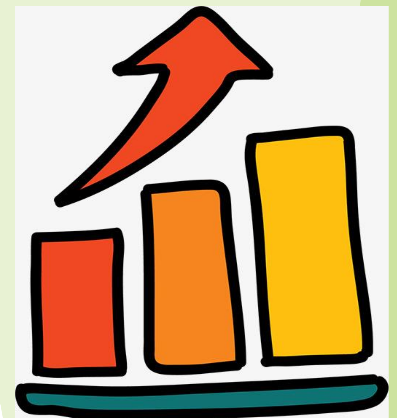
Fig. legenda, Arial negrito 20 pt

.At solmen va esser necessari far uniform grammatica, pronunciation e plu sommun paroles. Ma quande lingues coalesce, li grammatica del resultant lingue es plu simplic e regulari quam ti del coalescent lingues. Li nov lingua franca va esser plu simplic e regulari quam li existent European lingues.